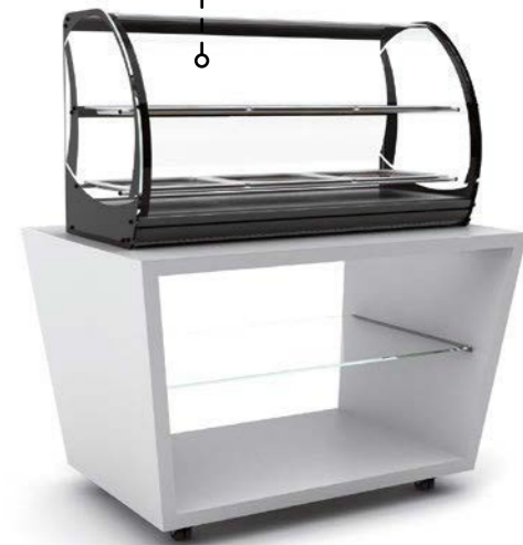
ACCESORIO AKCESORIA ACCESSOIRE STR. 120 /121