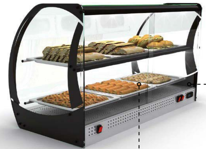
TEMPERATURA REGULABLE REGULOWANA TEMPERATURA TEMPÉRATURE RÉGLABLE