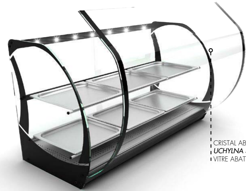
CRISTAL ABATIBLE UCHYLNA SZYBA VITRE ABATIBILE