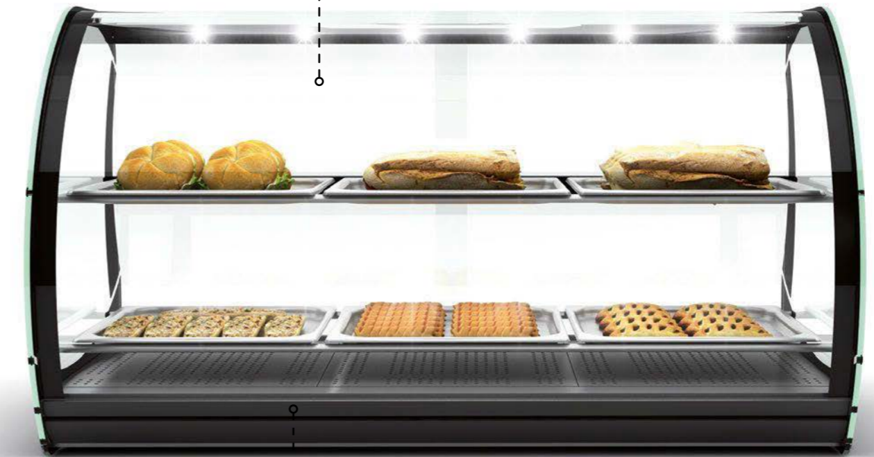
VITRINA CON MÁXIMA VISIBILIDAD MAKSYMALNA WIDOCZNOŚĆ PRODUKTÓW VITRINE AVEC UN MAXIMUM DE VISIBILITÉ