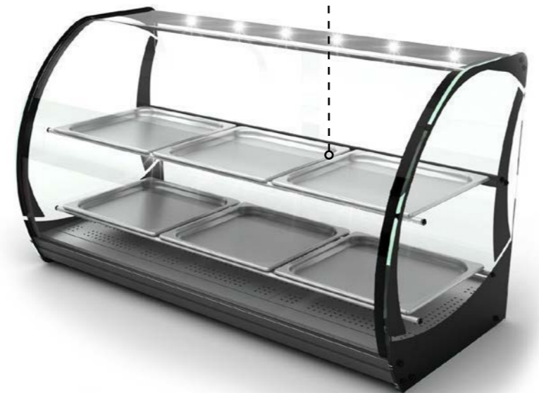
BANDEJAS INCLUIDAS GN 2/3 X 20 TACE GN 2/3 X 20 W STANDARDZIE BACS INCLUS GN 2/3 X 20