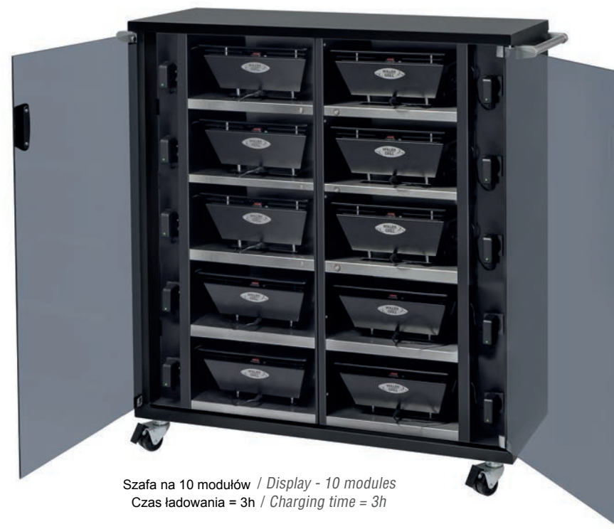
Szafa na 10 modułów / Display - 10 modules Czas ładowania = 3h / Charging time = 3h

gniazdo 5V - 2 A do telefonów, nóżki antypoślizgowe. Można przymocować do ściany.