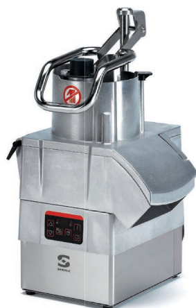
CA-401 VV (model 5-biegowy)