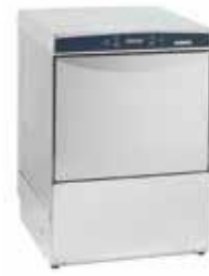
AF 40.30 E LS podblatowa 455x550x700 mm